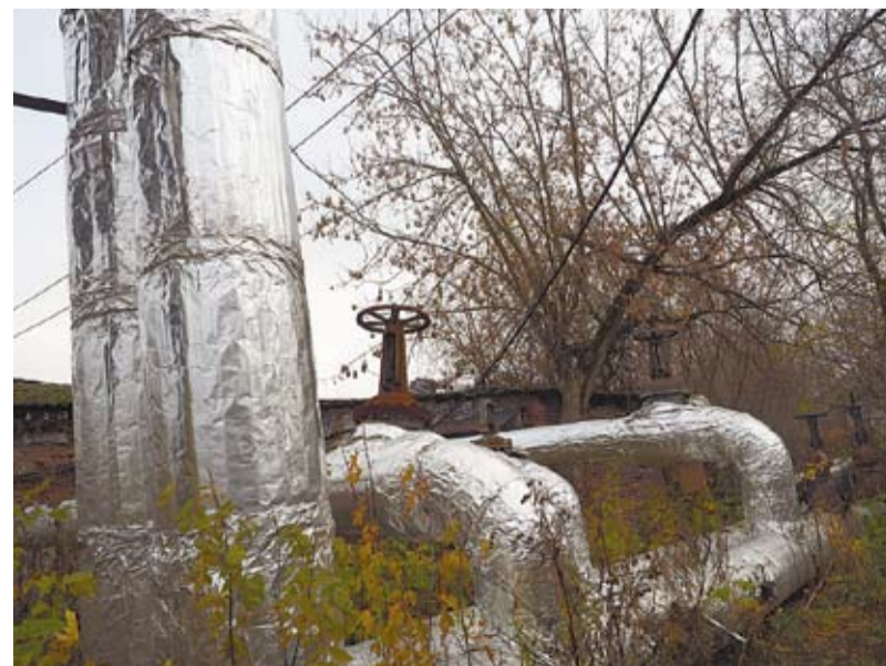
Новая теплоизоляция для снижения потерь