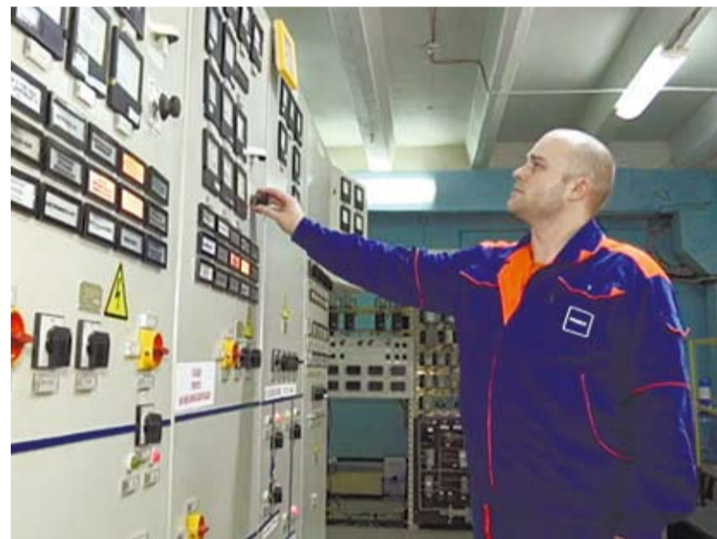
Главный щит управления